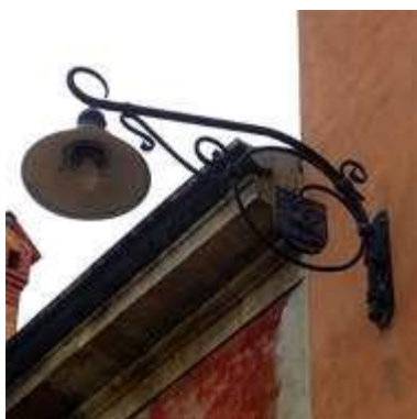
Slika 1: Obstoječa svetilka Lampara

Svetilka in stenska konzola, ki bo nadomeščala svetilke CSS in po potrebi tudi obstoječe svetilke Lampara, mora biti izdelana na podlagi obstoječih svetilk Lampara in priložene skice svetilke (Priloga_3_11_skica_Lampara). Predlog novelacije svetilke pripravi koncesionar, potrdi pa koncedent.