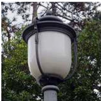
Slika 2: Svetilka Lanterna

Svetlobni vir (LED) mora biti prekrit s polprepustnim steklom ali UV obstojno umetno maso, ki zmanjšuje bleščanje. Vir mora biti nameščen v pokrovu svetilke in skupaj z zaščitnim steklom ali UV obstojno umetno maso ne sme gledati preko spodnjega roba pokrova svetilke.