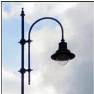
Slika 3: Dekorativni drog Neri Kuma in svetilka Neri Light 21

Predlog predelave svetilke pripravi koncesionar, potrdi pa koncedent.