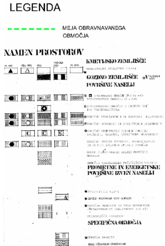
PRIKAZ ZASNOVE NAMENSKE RABE PROSTORA IN ORGANIZACIJE DEJAVNOSTI OBČINE IZOLE (SPREMEMBE IN DOPOLNITVE PROSTORSKIH SESTAVIN DOLGOROČNEGA PLANA OBČINE IZOLA ZA OBDOBJE 1986-2000 in DRUŽBENEGA PLANA OBČINE IZOLA ZA OBDOBJE 1986-1990)