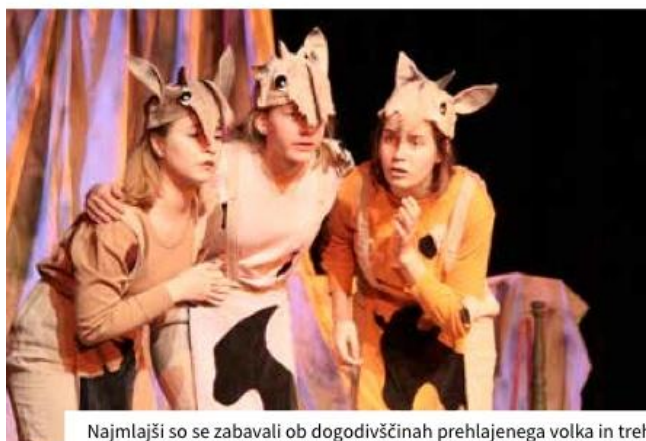
Najmlajši so se zabavali ob dogodivščinah prehlajenega volka in treh kozličkov v predelavi pravljice bratov Grimm Mogoče stare koze ni doma .