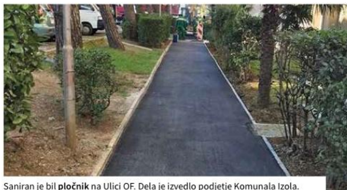
Saniran je bil pločnik na Ulici OF. Dela je izvedlo podjetje Komunala Izola.