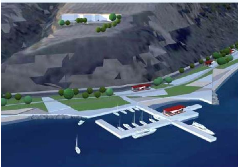
Eden od predlogov ureditve območja obalne ceste.

Povpraševanja po tovrstnih stanovanjih je s strani občanov res veliko. Ti imajo tudi prednost pri najemu. Verjame, da bo vseh 60 oskrbovanih stanovanj hitro zapolnjenih. Razpis je predviden v mesecu juniju, kar pomeni, da se bodo novi stanovalci lahko predvidoma selili že jeseni. Dodano vrednost pa bo predstavljal tudi center dnevnih aktivnosti, ki bo del novega objekta. Trenutno smo v fazi iskanja njegovega upravljavca, ki bo nudil čim bolj kvaliteten program in vsebine za naše upokojece.