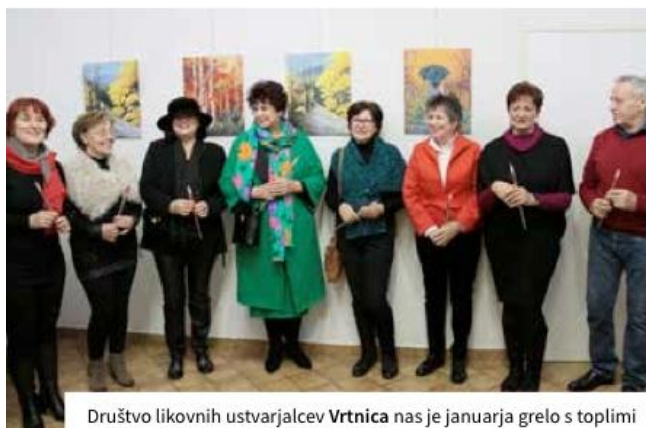
Društvo likovnih ustvarjalcev Vrtnica nas je januarja grelo s toplimi barvami razstave Jesenska čarovnja .