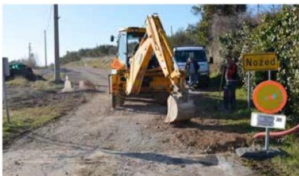
Na cesti za Nožed je bila urejena vodovodna in električna infrastruktura. Odsek je bil prav tako v celoti preplaščen. Za Rižanski vodovod Koper je dela izvedlo podjetje Grafist.