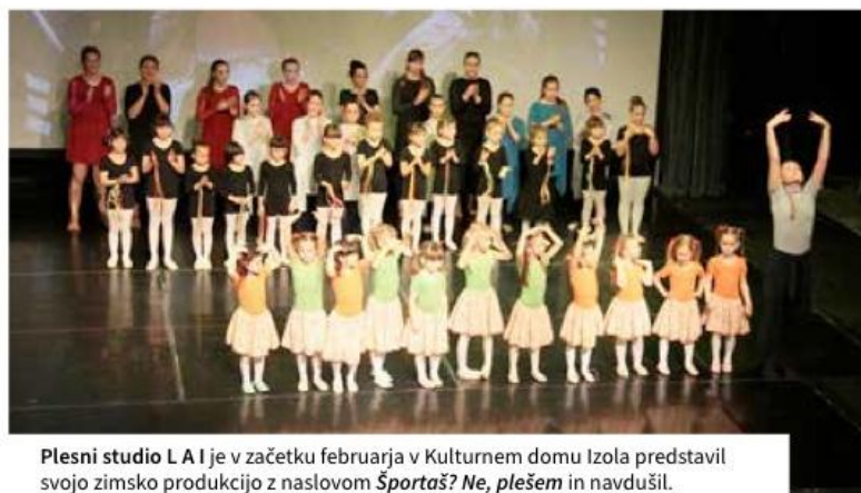
Plesni studio L A I je v začetku februarja v Kulturnem domu Izola predstavil svojo zimsko produkcijo z naslovom Športaš? Ne, plešem in navdušil.