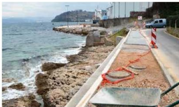
Urejen bo tudi pločnik na Ulici ob Pečini, kjer bo obložen spodnji zid. Urejena bo tudi javna razsvetljava. Za Rižanski vodovod Koper bo dela izvedlo podjetje Grafist. Ta bodo predvidoma zaključena do konca meseca.