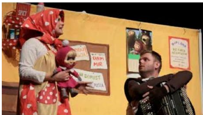
Najmlajše smo razveselili z gledališko predstavo Medvedja simfonija , v kateri so spremljali dogodivščine priljubljenih Maše in Medveda.