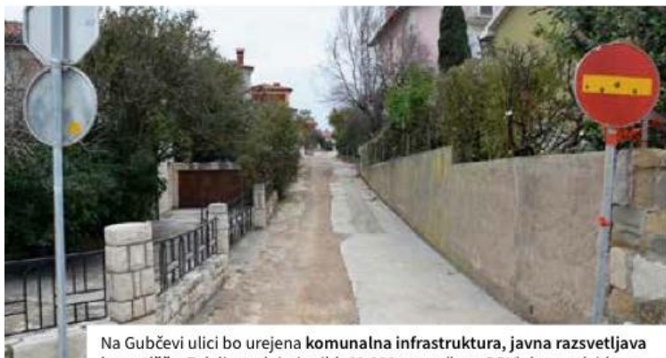
Na Gubčevi ulici bo urejena komunalna infrastruktura, javna razsvetljava in cestišče. Z deli, vrednimi pribl. 60.000 evrov (brez DDV), bo predvidoma konec meseca pričela Komunala Izola.