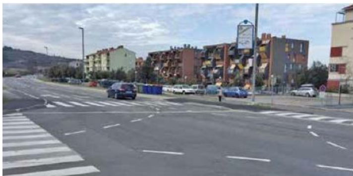
Na križišču med Južno cesto in Cesto v Pregavor je bilo poskrbljeno za dodatno varnost pešcev v prometu z dvema novima prehodoma za pešce, ki sta tudi arhitekturno prilagojena, in s prometno ureditvijo v samem križišču. Dela je izvedlo podjetje Komunala Izola.