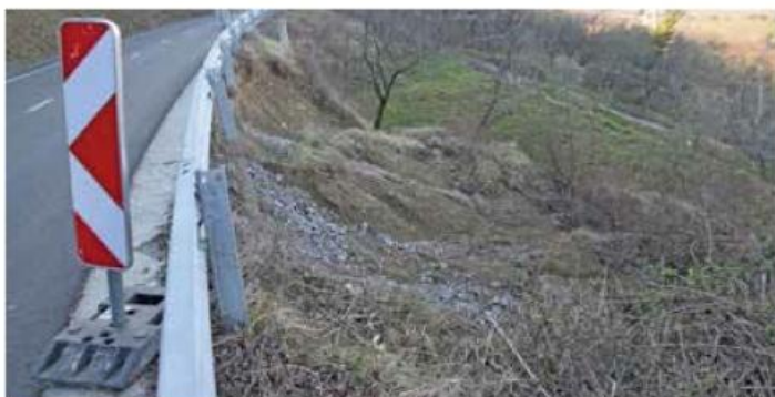
Na cesti proti Baredom bo saniran udor pod cesto, ki je posledica padavin ob koncu preteklega leta. Za projekt bo javno naročilo objavljeno še v tem mesecu.