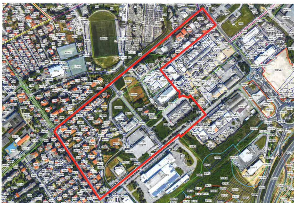
Slika 1: Območje urejanja z Odlokom o zazidalnem načrtu za območje Kajuhova – hudournik Morer v Izoli

Na območju se nahaja že delno zgrajeni objekt (hladilnice), ki ga investitor namerava nadzidati. S predmetnim odlokom se uskladi besedilo odloka z zatečenim stanjem in s sedaj veljavno terminologijo.